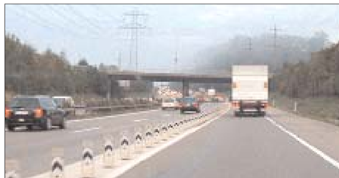
Der Stadtrat will ein Autobahnüberdachung für Affoltern. (A)

Die Nordumfahrung sollte auf einer Länge von rund 900 Metern überdacht und begrünt werden. Die Autobahn würde dann zwischen Rastplatz Büsisee und der Brücke Katzenseestrasse gedeckt. Im Gegensatz zur Überdeckung in Seebach steht das Projekt